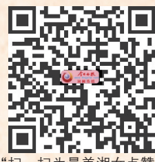
“扫一扫为最美湘女点赞”

今年3月开始，湖南省妇联组织开展寻找“最美湘女”活动。经过层层推荐选拔，征求相关部门意见，省妇联党组审定，共选出20名湖南省“最美湘女”。现将这些“最美湘女”公示，接受社会监督。如果你也被她们“美到”，就扫一扫右边的二维码，给她们点个赞吧。公示时间：11月30日—12月12日。