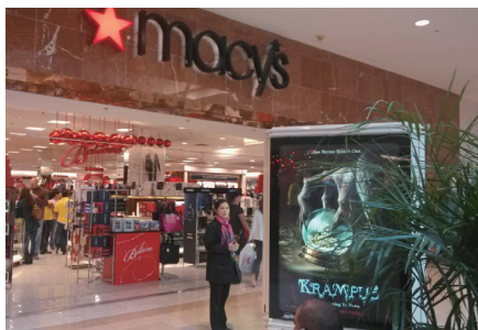
本报记者在美西百货前留影。

坐在壁炉旁，或读书，或聊天，或给远方的朋友发简讯、打电话——就像当年新大陆的移民感恩印第安人一样，两百多年来形成的传统似乎一成不变。也有一些人一边忙着自己的事情，一边收看电视台的感恩节大游行特别节目。这个节目有点类似于中国的春节联欢晚会，感兴趣的人从不落下，不感兴趣的人也就看罢了。而这种兴趣，并没有年龄、职业、信仰和民族差异。