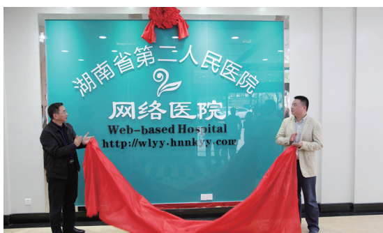
10月12日, 湖南省第二人民医院网络医院正式上线运行。

http://wlyy.hnky.com, 进行实名注册后, 即可与医生“面对面”交流, 再凭医生开具的电子处方就可以去药房买药了。