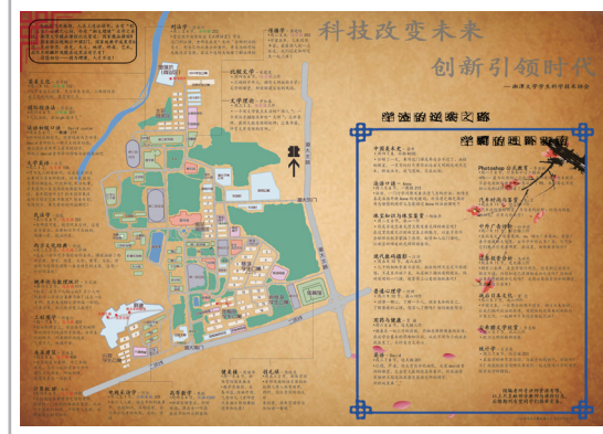
湘潭大学学生制作“蹭课地图”，为蹭课族提供便利。

今年 4 月，一份湘潭大学的“蹭课地图”在网络上流传开来。这份图文并茂的地图总结了该校诸多精品课程，列出了 32 门课程的名称、授课老师、授课地点及时间，并标注了具体位置，还以轻松诙谐的语言概括了课程亮点。地图上既有“将生涩定理讲成一部剧”的概率论与数理统计，又有“用汉字描绘生命”的文学理论，还有“用生命诠释刑法概念”的法学课，涵盖英语、民法学、工程图学、房屋建筑、比较文学、健美操等课程。授课教师既有国家教学名师，又有省级教学能手，还有受邀央视《法