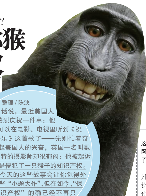
猕猴“鸣人”因为玩“自拍”而一举成名。

此外,在纽约,也有厨师对美国《纽约时报》表示,反对食客坐在椅子上拍摄美食照片、摆满三脚架把餐厅变为“射击场”。