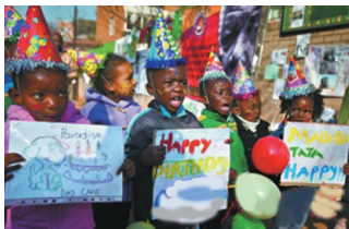
美国孩子庆祝《祝你生日快乐》歌解禁。