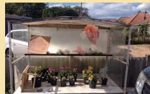
邻居家的零售车里,摆放着他亲手栽培的盆栽。

生活在英国,我也感觉到自己一直在被信任着。去超市购物,你可以选择自助结账,买了多少就支付多少,没人看着你是不是夹带了什么;在游乐场,你可以先玩再买票,游玩地距离购票窗口走路要10分钟,没人看着你,全凭自觉;在商场购物,你可以一个月无理由退货。一位朋友给孩子买了件T恤,结果小了,10天之后去还,商家直接收回衣服并退还购物款,根本不问原因。如果你要调换大一码的衣服,拿钱再买就行。甚至你租的房子租期是六个月,五个半月时房东请人为房子估价准备再出租,如果你说你带着孩子住这里,希望能多住半年或者一年,房东会立马同意,不会再让任何人来看房。