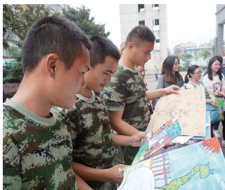
消防战士收到了孩子们画的特殊礼物。