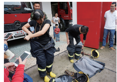
家长们计时与消防战士比赛速穿战斗服。