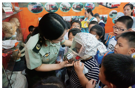
孩子们学戴防毒面罩。