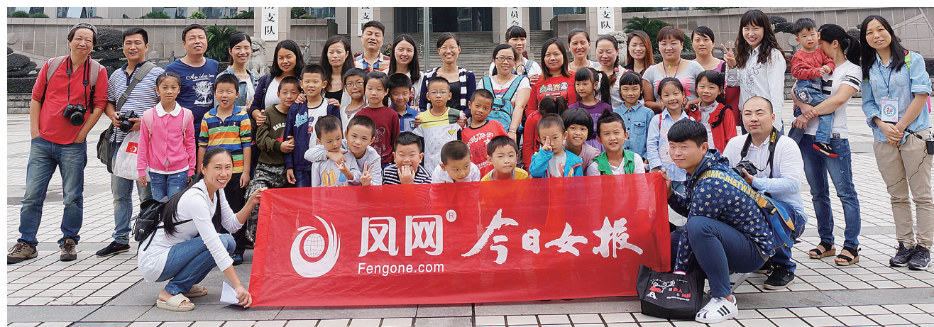
参与本期活动的亲子家庭大合影。

消防战士们给在场的家长和孩子上了一堂生动的实践课，让孩子们开阔了眼界，提高了安全意识和自我保护能力。这次活动也让大家对消防这一职业有了新的认识，对消防战士们有了更深的感激和崇敬之情。消防战士们勇敢、守纪的品质将激励着孩子们在以后的生活中变得更加坚强，怀着更多感恩的心健康成长。