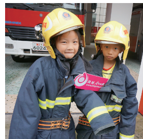
第一次穿上战斗服的“小小消防员”。