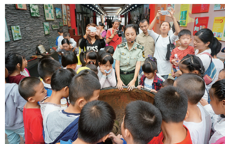
孩子们听讲解员姐姐讲述长沙消防的光荣历史。