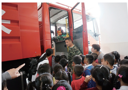
消防战士带领大家参观消防车。