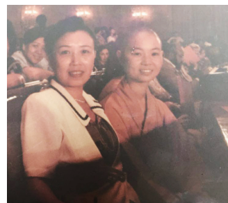
会场内，自然法师与代表们合影留念。

文中对中国妇女发展提出了一系列具体目标，如在“进一步提高妇女的健康水平”方面，提出“提高农村孕产妇住