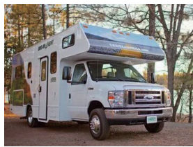
一辆车,也是一个温暖且自由的家。

火车和船上的家都有人尝鲜,美国人也不甘落后,这些年,他们越来越看好“房车”。这种可以拖在汽车后面行走的活动房屋,其实就是一个移动的“家”。