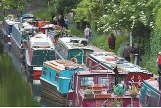
英国出现了越来越多的“水居族”。

当越来越多的外国投资者在英国买置地时,不少伦敦人却过起了以船为家的“离岸生活”。