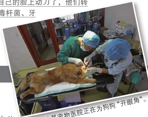
长沙某宠物医院正在为狗狗“开眼角”。

那么,如今长沙最热的宠物整容手术有哪些呢?“我们医院做得最多的是立耳术,从接诊的情况看,大型犬占50%,小型犬中,贵宾犬和吉娃娃占了70%。此外,技术含量高一点的就是切声带和植毛发,这是针对病态宠物犬做的手术。”谭孟告诉记者,在他看来,给幼犬整容不能算虐待,“有些狗狗有先天缺陷,比如萨摩耶犬耳朵直立不了,如果不早期手术,以后就无法纠正,而且这些手术在幼犬时期做,它们的痛感并不会太强烈”。