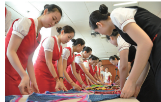
礼仪培训课堂上，学员们在老师的指导下动手操作。

据了解，湖南机场女职工学院除了开设政治理论课程、具有机场特色的安检、客运等岗位技能培训课程外，还设有极具女性特色的礼仪、烹饪、心理、婚恋课程；成立了女工艺术团，设有合唱队、舞蹈队、桥牌队、气排球队、太极拳、游泳等文体项目，在愉悦身心的同时提升了女员工的综合素质，受到湖南机场女职工的一致好评。