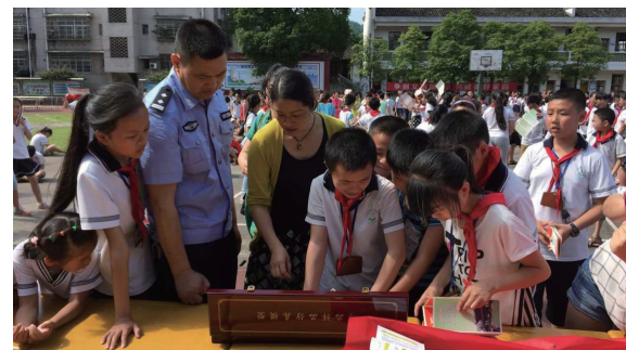
民警介绍各类毒品及其危害性。

今日女报 / 凤凰网（通讯员彭金玲）为迎接即将到来的第29个“国际禁毒日”，6月16日，怀化洪江市举行“珍爱生命·远离毒品”万人签名活动启动仪式。