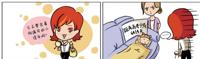
作者：豆沙包漫画王怡