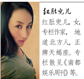
红肚兜儿 女，专栏作家，地道北方人，正牌天蝎座。专栏散见《南都娱乐周刊》等。

现实生活中，第一次见到爱情与死亡挂钩，是在我读小学五年级的时候。班上一个男生喜欢同班那个文静成绩好的女生，给她一连写了好几封情书，都被拒绝了。然后某天下午，我就听到了那个震惊全校的消息——男生伤心过度吞服农药自杀。