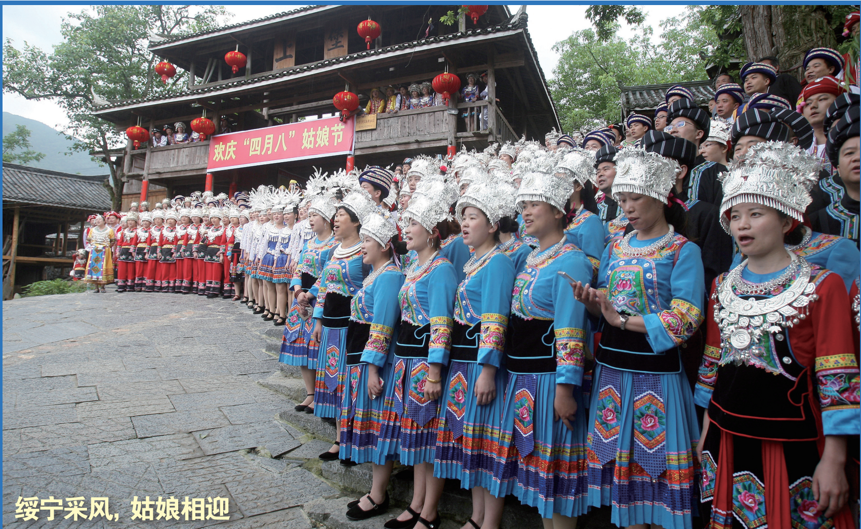
绥宁采风，姑娘相迎

不但有美丽风光可赏，还有独特民俗可看，甚至还有美丽姑娘相迎，5月去邵阳绥宁可讨个大便宜。5月9日至10日，凤网/今日女报组织湖南省内的新媒体、自媒体大号、微博大V和摄