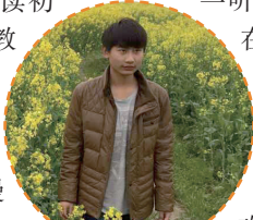
现在的儿子懂事好学，让妈妈意识到自己之前确实有些过分。

经过半年后，我就发现，以前自己不能接受的事情，现在也都能接受了，而且在孩子的教育上学会了克制自己。此外，我还发现，老公的“无为”理念确实有一定的合理性，虽然说短期内看不出来，但时间一长，孩子确实也还是有改变的。