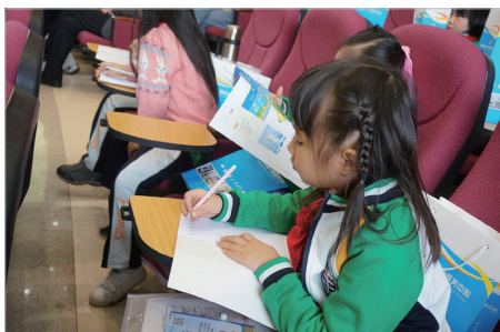
孩子们认真做着笔记。