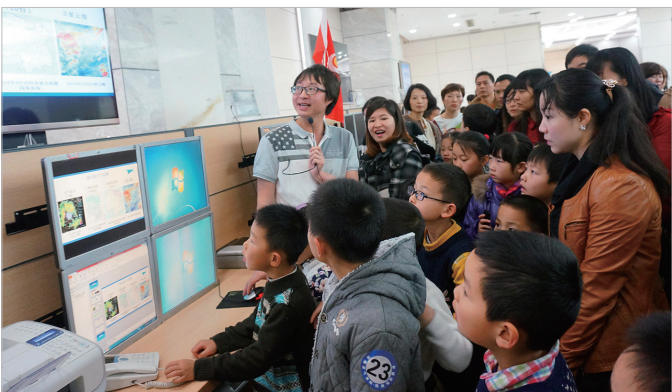
大家认真了解天气预报的制作过程。