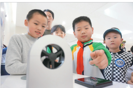
孩子们通过模型感受风力。