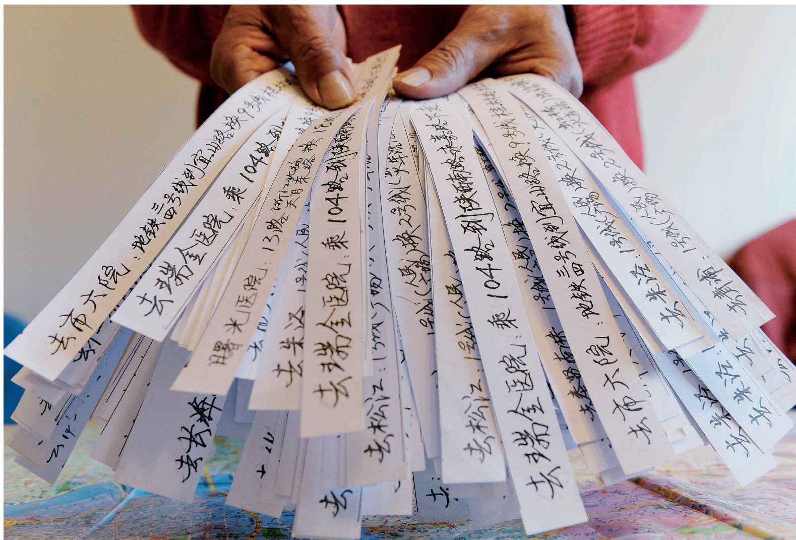
这些写满密密麻麻字的线路小纸条，既记录着各大医院及旅游景点等信息，也记录着老人为他人服务的无限热情。