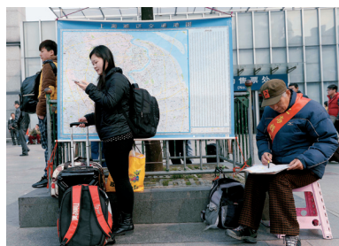
在空暇之余继续在地图上熟记线路。