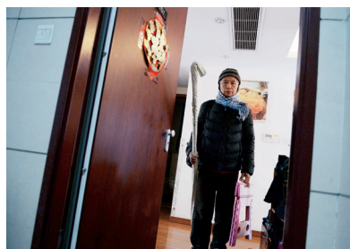
无论刮风下雨，每次他都是这样提着板凳和地图走出家门。