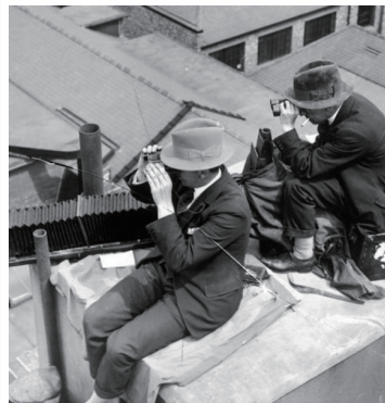
狗仔队工作其实也有危险

自己生活被偷拍后，明星们其实并没有那么好脾气，吴彦祖一直公开要求立法保障市民隐私，且香港法律改革委员会向香港立法院提交提案，要求限制偷拍，任何人未经当事人的许可便进入其私人地方，或利用监测仪器搜集资料，已经构成刑事罪行。