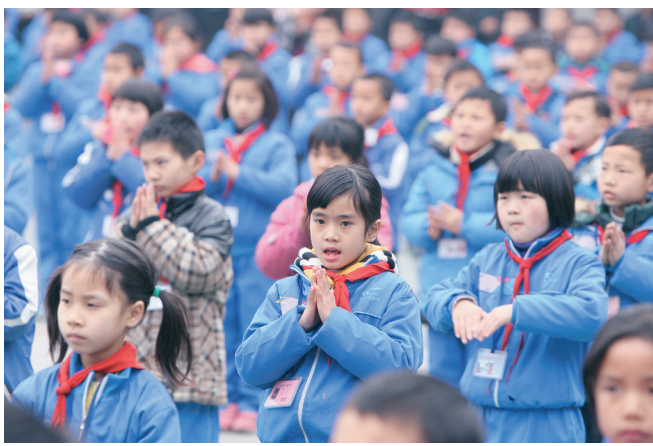
麻阳苗族自治县吕家坪镇中心小学学生在活动现场用手语表演《感恩的心》。