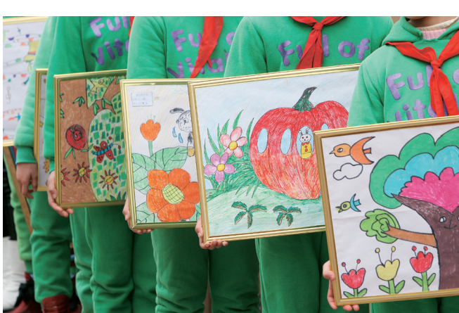
孩子们亲手绘制的一幅幅画作饱含着对社会各界的感激之情。