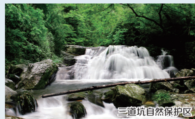
三道坑自然保护区