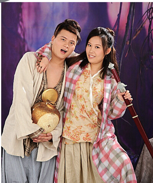
相识独特，婚纱照也独特。

第二天晚上，我居然又有了给她发信息的冲动，忍到11点，最终没忍住，发了一条“嗨，睡了吗”这种傻不拉叽的话。不过也就是这样的话，又打开了我们聊天的的大门。这次除了聊我，还聊了她。她是快毕业来长沙找工作的，最近在实