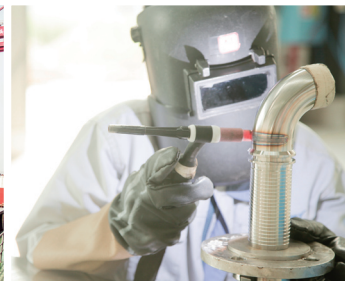
PM4:00 临港园区工厂 工厂内的工作需要专注与细致。