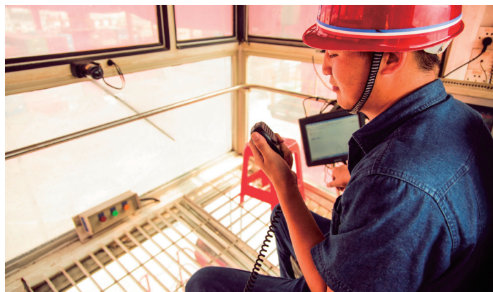
AM10:00 桥吊驾驶室 坐在这上面看到的风景是不是也会不一样？

●湖南岳阳城陵矶综合保税区、进口肉类指定口岸、汽车整车进口口岸三大对外开放平台已成功获批。三块“金字招牌”的落户，这将有利于放大岳阳临江沿湖的区位优势，让“河港变海港，境内变境外”，将有力地推动湖南外向型经济发展。