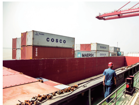
PM2:00 货轮 装载完毕，码头工人检查后，它们就要从这里走向全球。