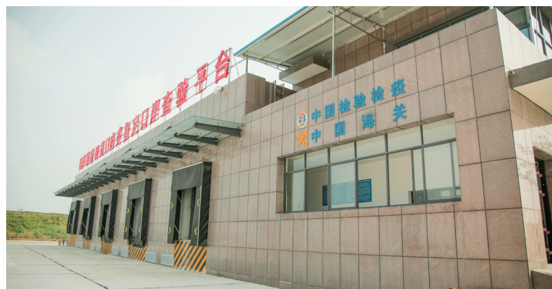
PM5:00 进口肉类指定口岸检验平台 成功运转后，绝大多数进口肉类将从这里送到湖南人的餐桌上。