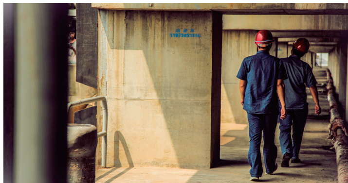
AM11:00 码头 安全是码头作业的头等大事，工作中大家到哪里都戴着安全帽。