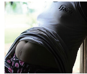
遇挫折,甚至酿成悲剧。

我们常说人的身体要健康,就要“缺啥补啥”,否则就会导致身体的不适或生病。同样的道理,孩子要健康成长,也同样应该“缺啥补啥”,只不过他们应该补的不是营养,而是教育,是爱。如果孩子的成长过程中缺少了某些必须的教育和爱,就可能走上弯路,遭