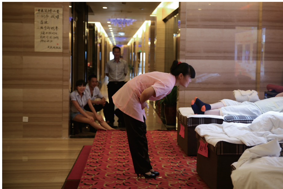
足浴城里，如果技师能够让顾客主动来点钟，还可以得到额外的奖励。