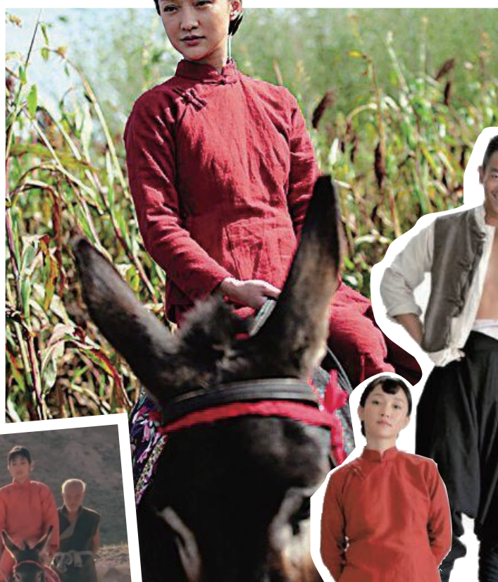
周迅版九儿显灵气

陈酿26年,郑晓龙版《红高粱》加上了日韩剧味道,并把美剧方式当调料。当年山东范儿的巩俐因为饰演九儿走向世界,如今周迅却给九儿附上了江浙女子的味道。到底是原版“红高粱”好喝,还是重新调制得像鸡尾酒的“红高粱”美味?10月30日,今日女报/凤凰网记者通过山东卫视联系上了《红高粱》作者莫言及其大哥,没想到兄弟俩对新酒不但有话要说,而且对于新旧九儿也是各看各爱!