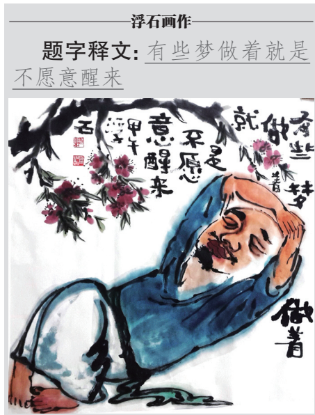
浮石画作 题字释文：有些梦做着就是不愿意醒来

前几天和一起排话剧的几个姑娘聊天。她们都还没从学校毕业，大学学的都不是艺术专业，家里人几乎都不支持她们搞话剧，她们全部都面临着各种考级考证考研找工作的压力，却依然坚持着没有丢掉话剧。问她