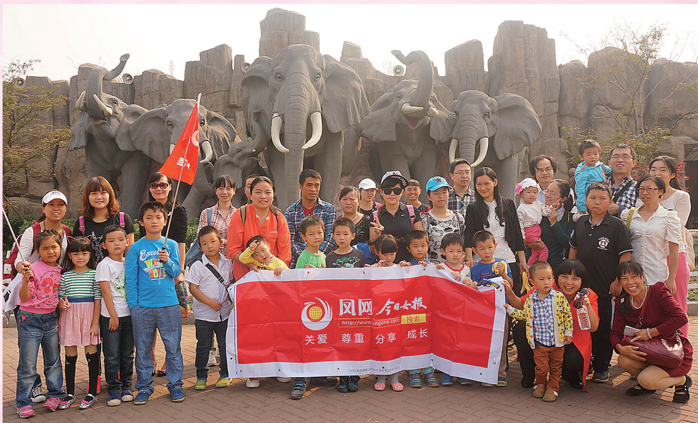
参加游园活动的凤网会员们在长沙生态动物园门口合影晒幸福。