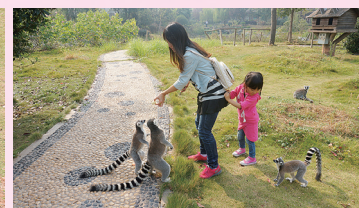
“跟在妈妈的身后, 小狐猴还真可爱。”

赶紧去给可爱的小狐猴喂食, 有香蕉、红枣、苹果。小狐猴想吃水果又够不着会两腿立起, 像人类一样站起来, 还会把“手”伸过来接食物, 真的萌化了! 文文喂了一次又一次, 开心得想把小狐猴抱回家! 再次见到车行区的斑马, 骆驼, 老虎, 狼, 孩子们活跃得不得了, 一会喊狼来啦! 狼来啦! 一会喊: 下一个肯定是羊!