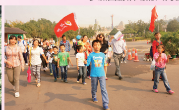
看动物的会员们, 跟着小队长往这边走。