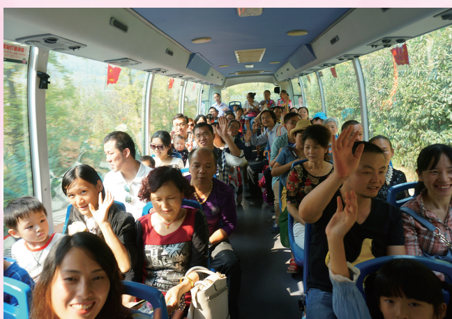
会员们, 举高手跟大家打个招呼吧!