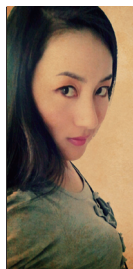
红肚兜儿 红肚兜儿，女，专栏作家，地道北方人，正牌天蝎座。专栏散见《南都娱乐周刊》等。