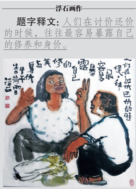
浮石画作 题字释文：人们在讨价还价的时候，往往最容易暴露自己的修养和身价。

菜市场里，大妈买菜为了精减几毛钱，磨破嘴皮，而CEO会把精力花费在收购价格上。这是角色。出门在外小费给多少，为卖家考虑，不为小钱较劲。这是修养。而绕远路骗车费是欺诈，被发现还狡辩是不诚信，拒绝沟通强要钱是素质低下，而我不敢说是懦夫，不维护自己的权益只敢事后评论是软弱。尤其，我不了了之的态度是助纣为虐的点火器。这真不是钱的问题，是对与错的问题。