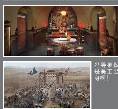
冯导果然还是美工出身啊!