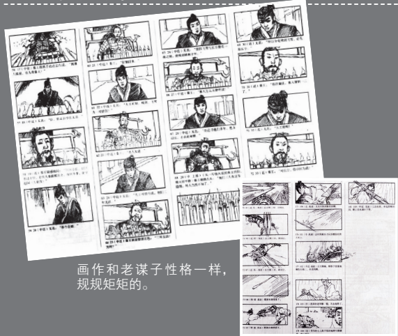
画作和老谋子性格一样,规规矩矩的。