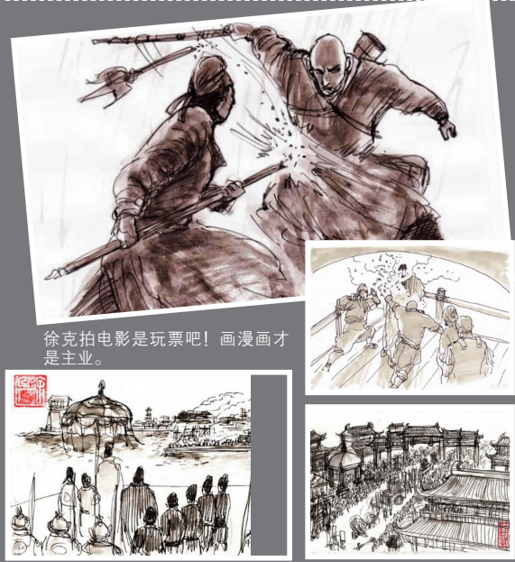
徐克拍电影是玩票吧!画漫画才是主业。