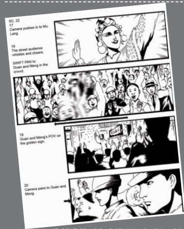
谁都没想到高晓松画画如此细致!