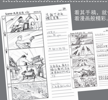
看其手稿,就像看漫画般精彩。