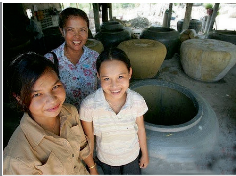
柬埔寨“女儿国”居民自给自足。

近日,巴西东南部一个居住着超过600名女性、完全由女子“当家”的小镇就向全球单身男性发出了邀请,欢迎他们到“女儿国”成家立业。其实,“女儿国”并不止存在于中国的神话故事里,它早已在世界各地开花——让我们一起来看看这些现代“女儿国”里的喜怒哀乐吧。