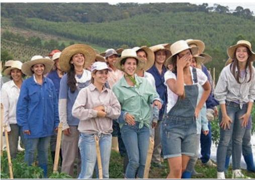
从农耕到城市规划,巴西“女儿国”居民们都一手操办。

“请到我们的镇上来成家立业!” 这样的一份邀请,乍看并没有什么出奇——但如果这个小镇完全是一个女人的世界,如同《西游记》中的“女儿国”,不知单身的男士们可否消受此等“福利”?