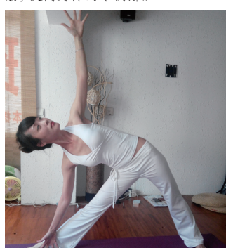
动作三: 三角伸展式