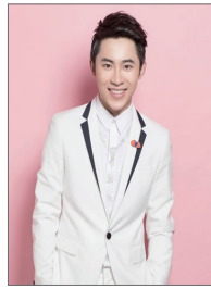
神秘彩妆专家: 马锐(国际著名彩妆师,《Elle》杂志签约彩妆师)