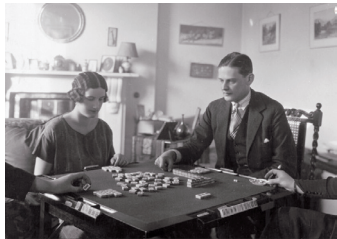
1925年，俄罗斯的亚历山德罗王子和保罗公主在伦敦的别墅中打麻将。

国际上大的麻将比赛，都有一套《中国麻将竞赛规则》，但这项规则每年都会有变化，由举办方在赛