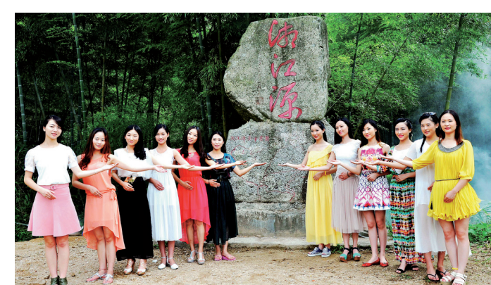
湘江源形象大使12强。

12名“湘源妹”下车后，映入眼帘的是两块大石头叠成的石碑，石碑下方是湘江源头的地理图。石碑立在竹林掩映的小溪旁，小溪就是湘江的源头。