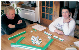
荷兰人在家中打麻将。

前印制规则发放。而中国的中国麻将种类颇多，没有一个统一标准，也限制了中国选手在国际大赛上的发挥。例如四川麻将要“血战到底”，长沙麻将讲究短平快，东北麻将注意方位花牌转换等，这些不同的玩法，限制了中国参加国际大赛的水平。