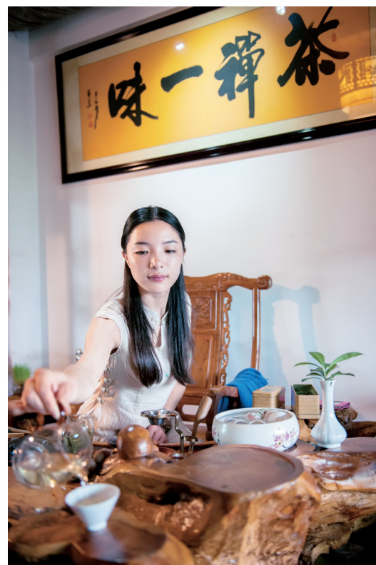
凡有朋自远方来，梅子自会拿出看家本领招待。