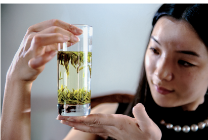
煮茶笑对人生，何不来此偷得浮生半日闲？