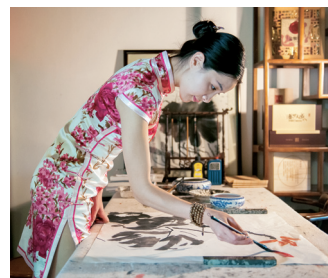
偶尔，梅子也会重拾读书时的梦想，挥毫于纸上。