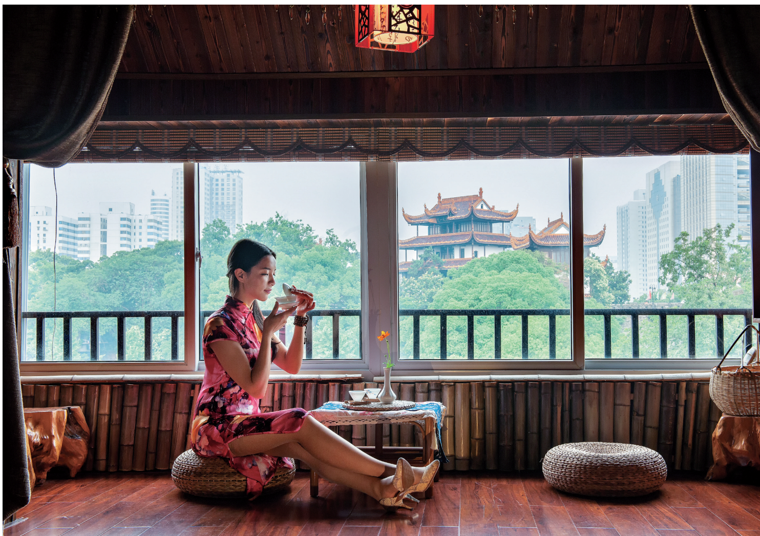
品着那杯清茶，思着故乡的云霞，抬头望见飞燕，低头沉思悟茶。