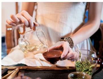
沏茶、品茶是梅子每天必不可少的功课。