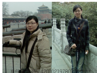
身份证号: 42010219780**** 图片经服用者授权为“红魔瘦身中心”所有,不得转载

看着一个多月前和现在的照片,连我自己都不敢相信!可我实实在在不到两个月减了30多斤,而且皮肤还更加紧致有弹性了!红魔是我用过效果最好的!