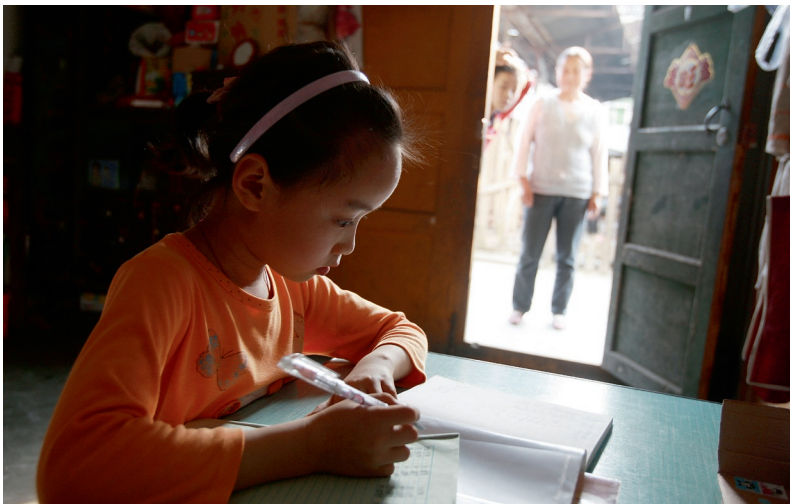
虽然周末是特意来陪孩子的，但家长也会看着孩子写作业。