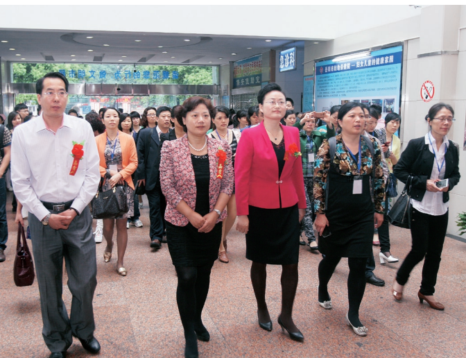
5月10日上午,在岳阳市妇幼保健院举行全国PAC优质服务示范医院揭牌仪式。省妇联副主席卢妹香、中国妇女发展基金会伊爱基金主任张彦明、岳阳市妇联主席魏淑萍,以及院领导,妇科部分医护人员参加了授牌仪式。