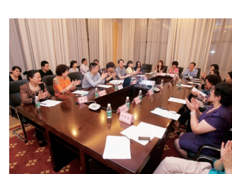
知名妇产科专家齐聚一堂,成立湖南省PAC项目专家工作小组。

同时,此行还举行了岳阳市妇幼保健院授牌仪式以及开展“送健康进高校”专家讲座和义诊咨询活动。