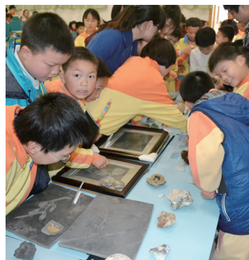
活动现场，同学们与各种矿物标本亲密接触。