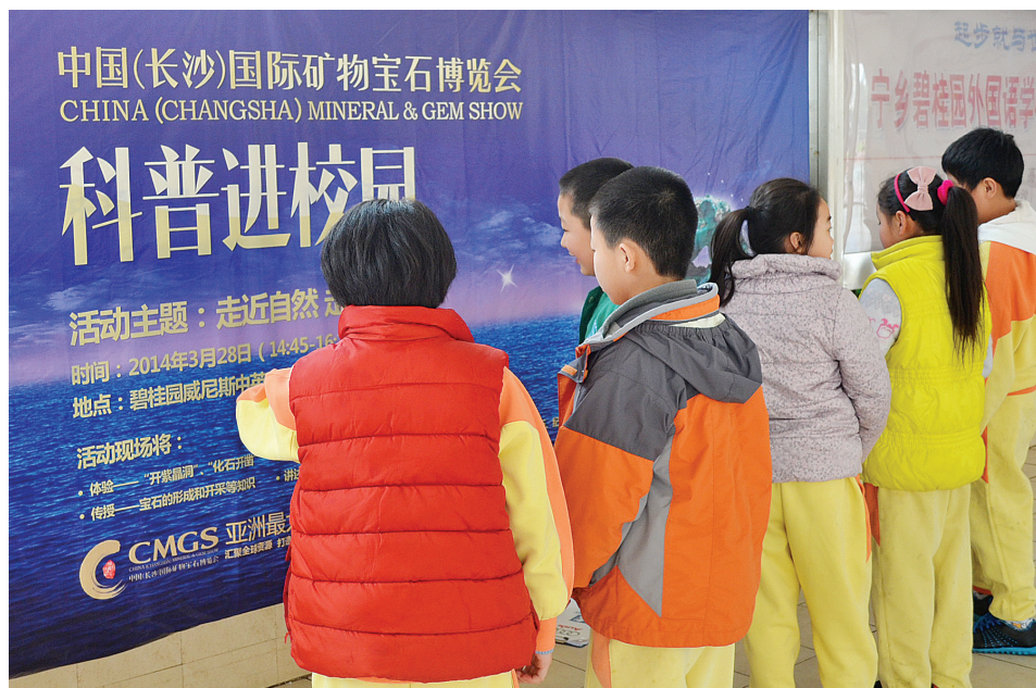
“CMGS科普进校园”活动吸引了许多小朋友前来观看。

此次科普活动进校园活动圆满结束，但是博览会的科普教育之路仍在继续。中国科学院院士、“嫦娥之父”欧阳自远院士曾经说：“做科普，是一种责任。”这也正是中国(长沙)国际矿物宝石博览会所坚信的。