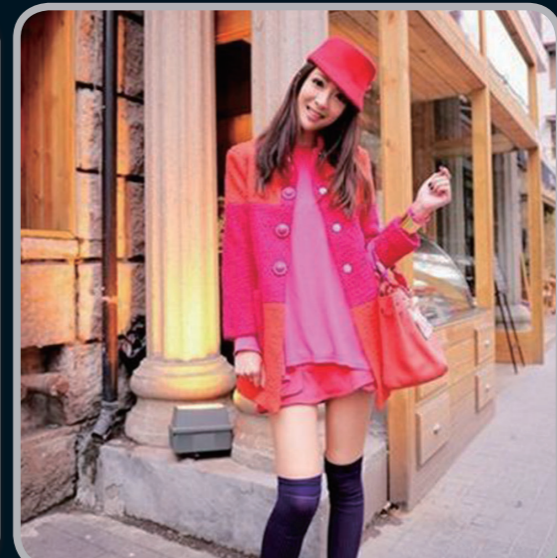
情人节约会搭配单品:玫红色风衣外套