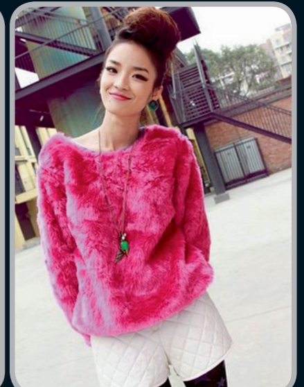
情人节约会搭配单品:玫红色毛绒外套