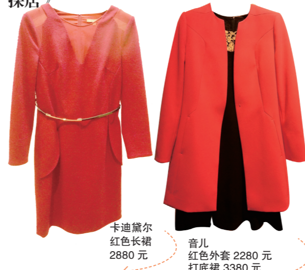
卡迪黛尔 红色长裙 2880 元