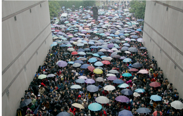
抢工作: 武汉华中科技大学西十二教学楼考点, 国家公务员考试公共科目笔试开考——抢个“铁饭碗”的执念, 让无数年轻人挤上了考公务员的窄桥。