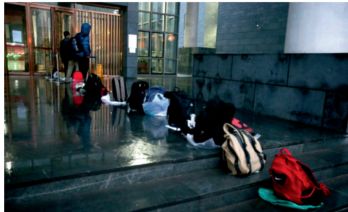
抢座位: 清晨6时30分, 天未亮, 下着小雨, 气温很低——中国人民大学图书馆外就已经出现了一排排代表考研的主人们而早早来占位的“书包”。