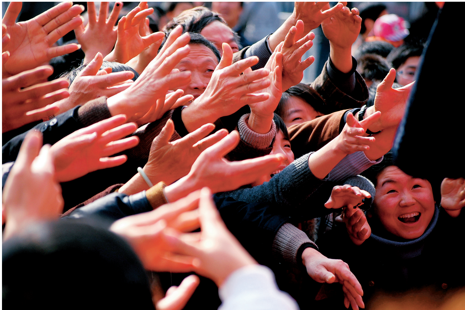
抢手机: 重庆市合川区某商场打出“免费送手机”的广告, 市民们疯抢“领机卡”, 场面近乎失控。