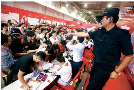
抢房: 浙江宁波某楼盘开盘, 引来5000购房者抢购。现场不仅通过摇号限定购房先后批次, 还出动了大量安保人员维持秩序。