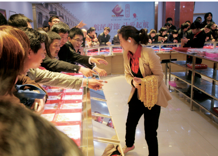
“抢”黄金: 不差钱的“大妈”们狂“抢”黄金, 营业员不得已将棉花塞进耳朵里“降噪”。