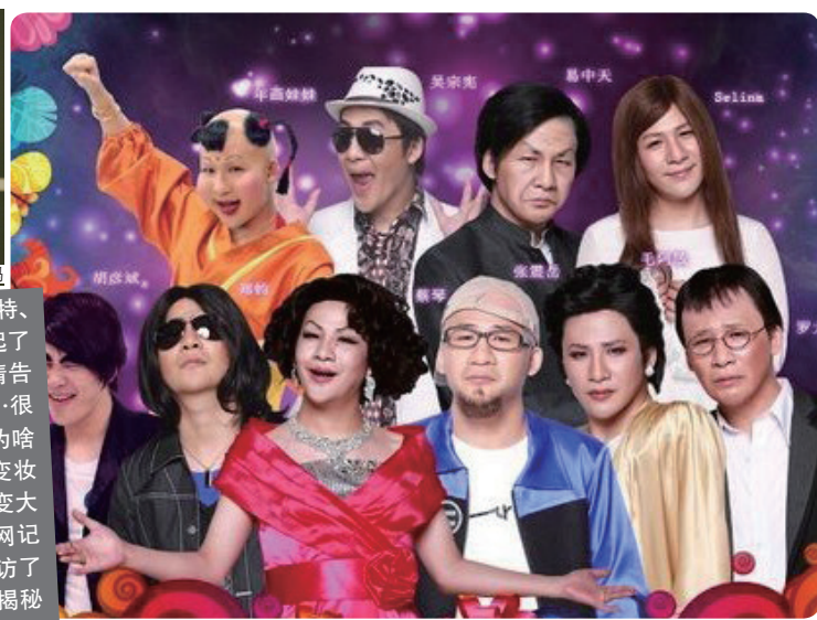
大张伟的百变造型