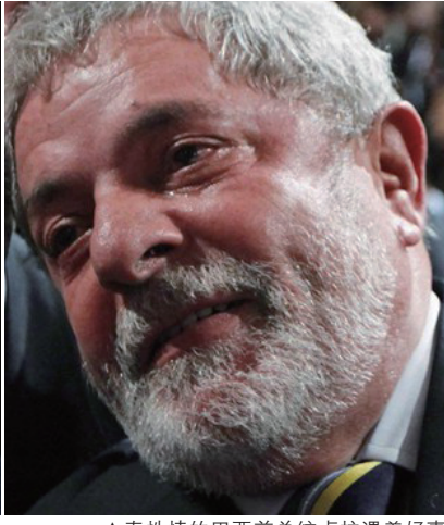
▲真实性情的巴西前总统卢拉遇着好事也会大哭；2009年，巴西里约热内卢申奥成功，卢拉难掩激动，哭得满面通红。